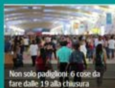
Non solo padiglioni: 6 cose da fare dalle 19 alla chiusura