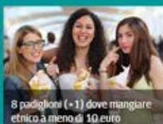
8 padiglioni (+1) dove mangiare etnico a meno di 10 euro